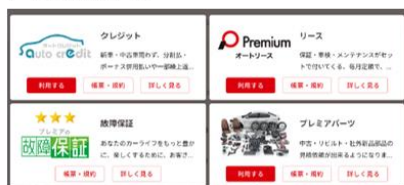
▼一般加盟店メニュー